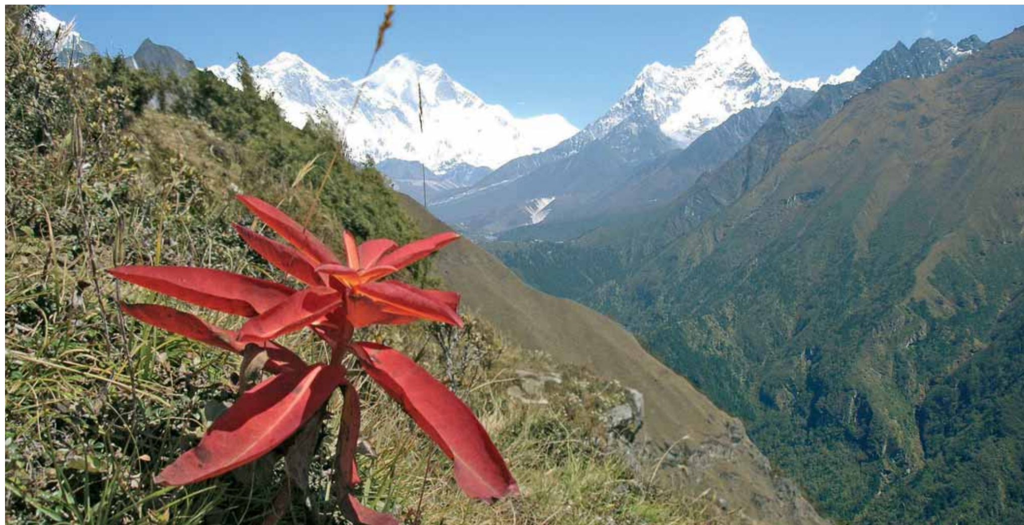
IN LONTANANZA, LA CIMA DELL'AMA DABLAM, CHE NELLA LINGUA LOCALE SIGNIFICA «LA MADRE CON LA COLLANA». È L'ULTIMA CONQUISTA IN ORDINE DI TEMPO DELL'ALPINISTA BOLOGNESE

tante spedizioni, questa è la prima in cui mi vedo costretto a modificare il piano voli in corso d'opera. Tutti sentiamo però di esserci guadagnata sul campo un'ultima chance, per la nostra volontà e determinazione. Avverto che l'operazione potrebbe non essere indolore, sia in considerazione degli eventuali costi sia, principalmente, riguardo alla difficoltà di spostare a una data decisa a tavolino i voli di tutti in un periodo di altissima stagione. Ricevuto l'assenso unanime per un estremo tentativo, accada quel che deve accadere, prendo a prestito